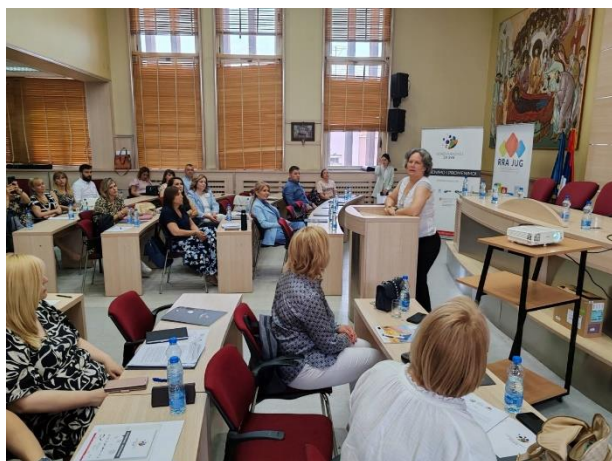
Fotografija 1: Konferencija Ključni faktori održivosti lokalnog ekonomskog razvoja , Pirota, 20. jun 2024. godine

Nalazi i preporuke se odnose na podršku ostvarivanju Agende 2030 u oblastima obrazovne politike i posebno dualnog obrazovanja, jačanje mehanizama za razmenu iskustava i horizontalnu i vertikalnu koordinaciju u planiranju kroz Regionalne savete u okviru RRA „JUG“ i dalji nastavak aktivnosti na unapređenju međuopštinske saradnje u komunalnim delatnostima – održivom upravljanju otpadom u Pirotskom upravnom okrugu.